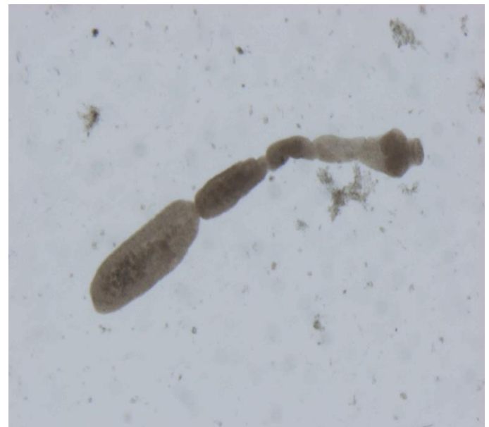
Echinococcus multilocularis adulte © LNR Echinococcus spp.

Echinococcus multilocularis est un petit tænia appartenant à la classe des cestodes. Il est responsable d'une zoonose parasitaire provoquant une maladie hépatique potentiellement grave, l'échinococcose alvéolaire. Le cycle parasitaire se déroule principalement dans la faune sauvage, le ver sous sa forme adulte se trouve dans l'intestin d'un carnivore sauvage, le renard, qui est l'hôte définitif. Dans l'intestin, le parasite se développe entre les villosités et produit à maturité des œufs (ou oncosphères) qui sont libérés dans le milieu extérieur avec les fèces.