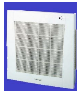
Split cassette murale